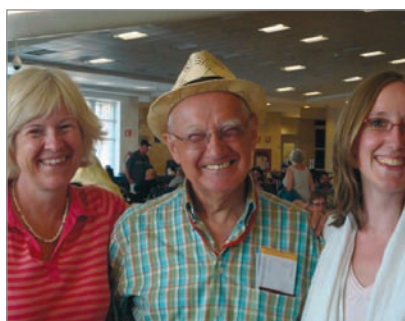
Das letzte Bild vom NFP-Team vor dem Flug nach Hause.