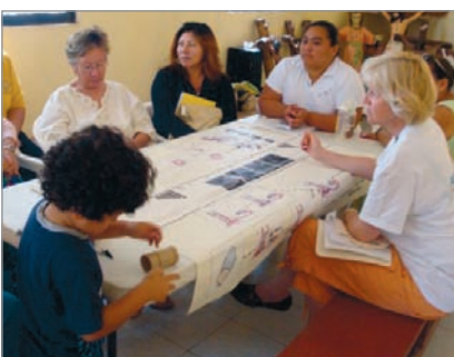
Die tägliche Arbeit in den Frauenrunden.

In den Mayadörfern sprachen wir mit Frauen jeden Alters über die Sprache des weiblichen Körpers. Nach anfänglichem Gelächter entspannte sich die Atmosphäre