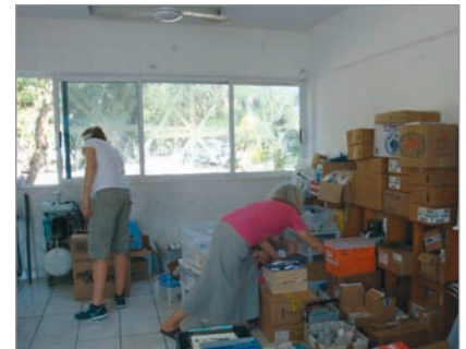
Am ersten Tag wurde die Apotheke erstellt, die von Dorf zu Dorf mitgenommen wurde.